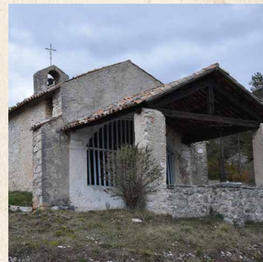
La chapelle Saint-Roch