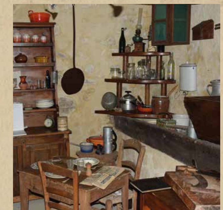
La Sagne et son écomusée (à visiter) 3 km, direction Comps-sur-Artuby.