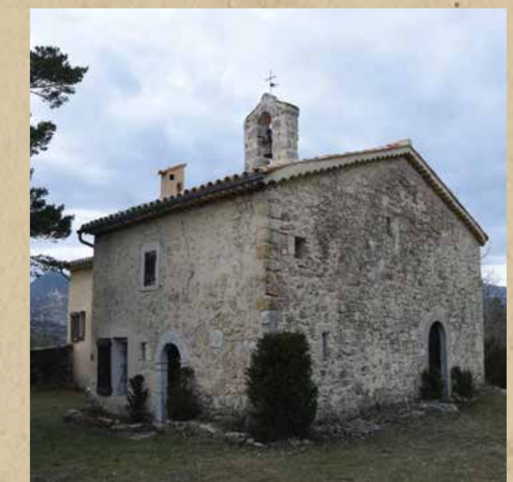
La chapelle de Notre-Dame-de-Saint-Julien 2,5 km, lieu-dit La Clape.