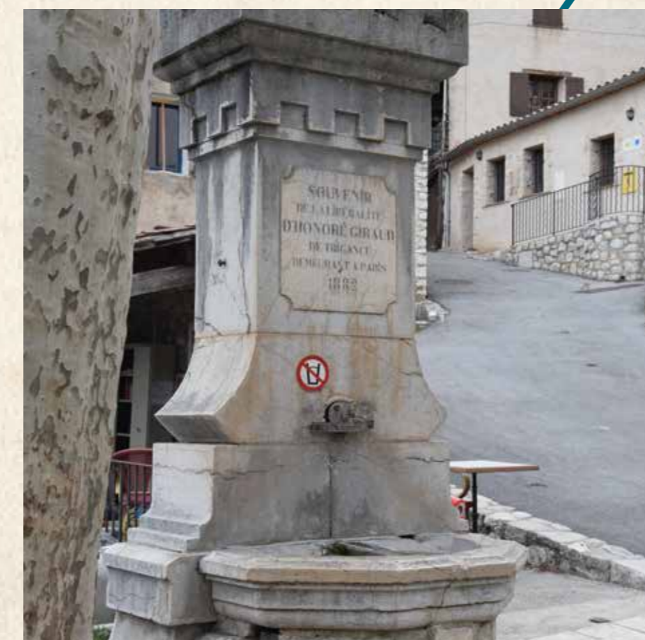
La fontaine Giraud