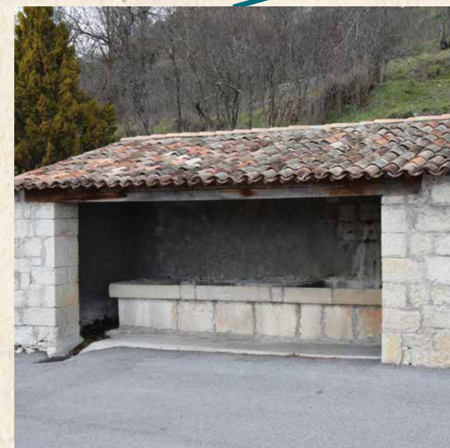
Le vieux lavoir