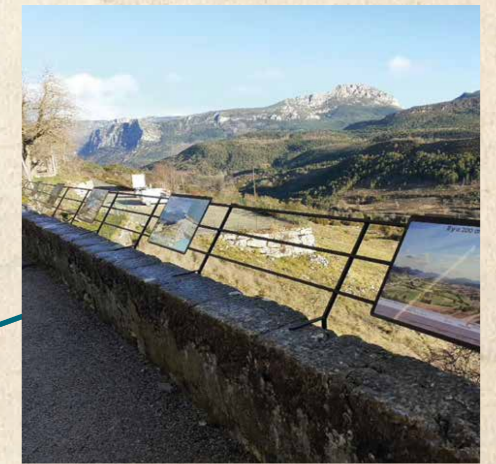
Le mur préhistorique