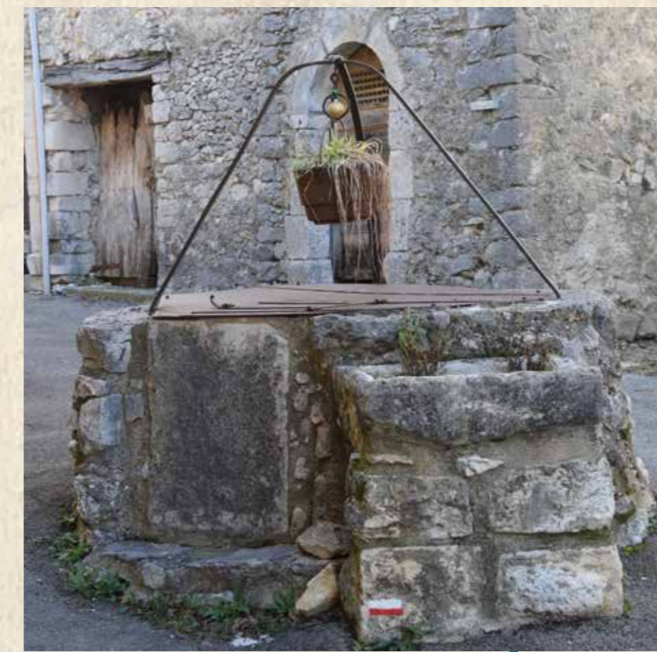
Le puits de Farlepous