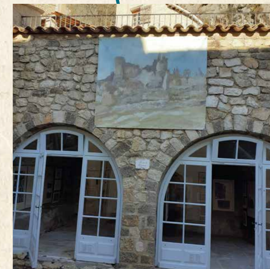
Le musée des Voûtes (à visiter)