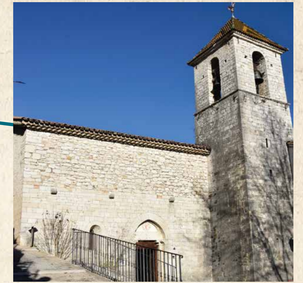
L'église Saint-Michel et sa tribune (à visiter)