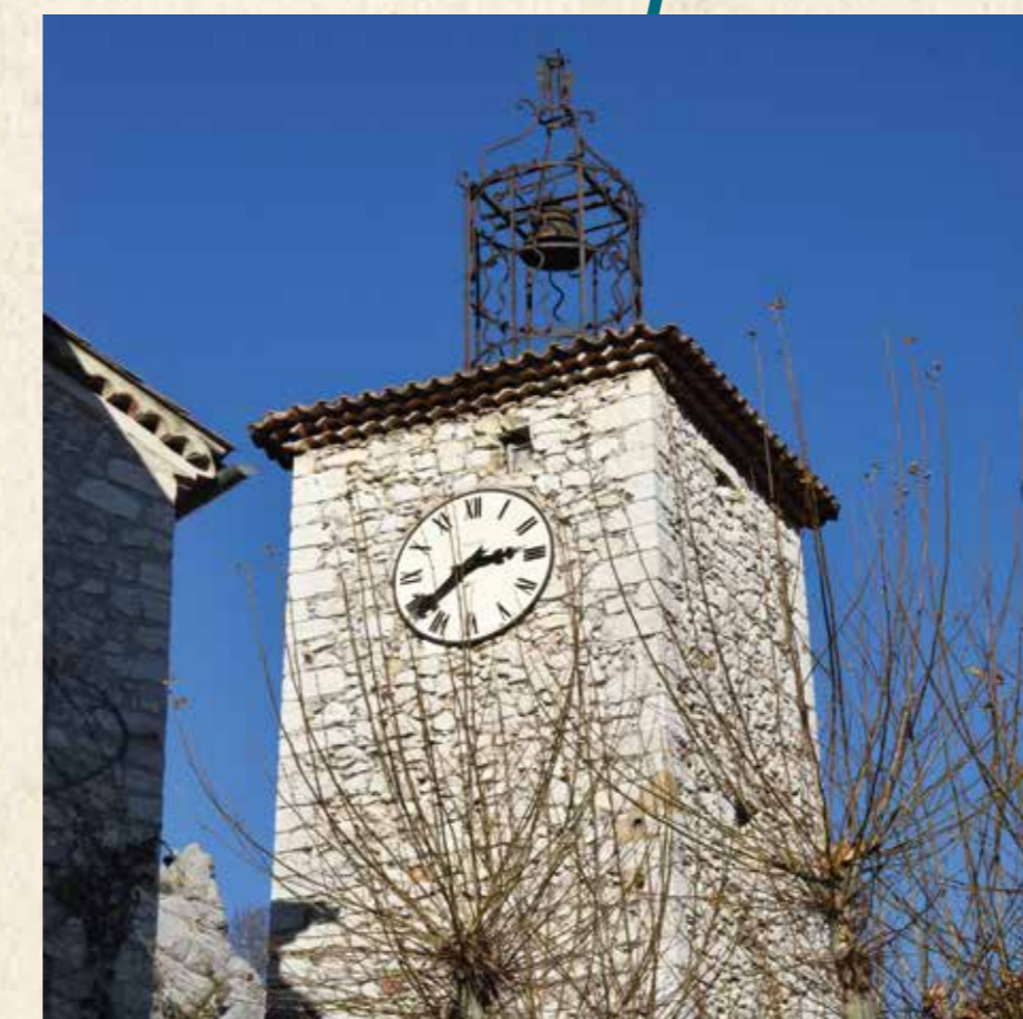
La tour de l'horloge