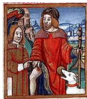
Saint Roch tenant son bourdon et montrant sa plaie.

– Concours de boules mixte pour les participants à l'Aïoli